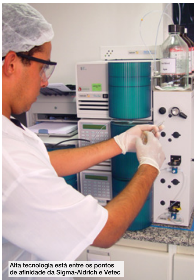
Alta tecnologia está entre os pontos de afinidade da Sigma-Aldrich e Vetec