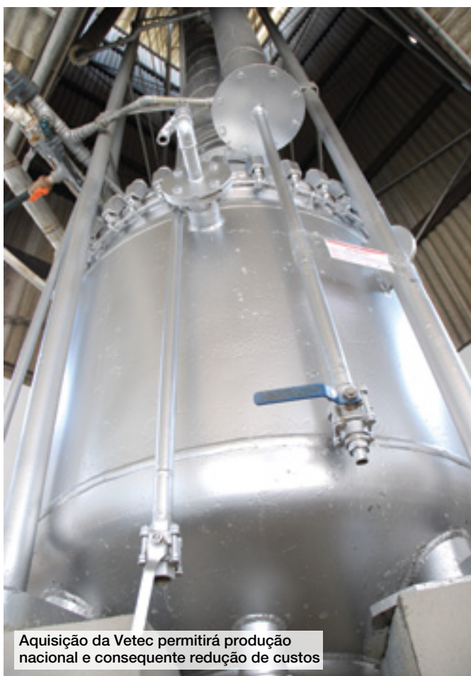
Aquisição da Vetec permitirá produção nacional e consequente redução de custos

Presente no Brasil desde 1992, foi há seis anos, com o estabelecimento de estoque local em São Paulo e melhoras na operação e logística, que a multinacional Sigma-Aldrich consolidou sua presença no mercado brasileiro. Na época, houve uma reestruturação geral da empresa, principalmente nos sistemas e na infraestrutura. Nos últimos cinco anos,