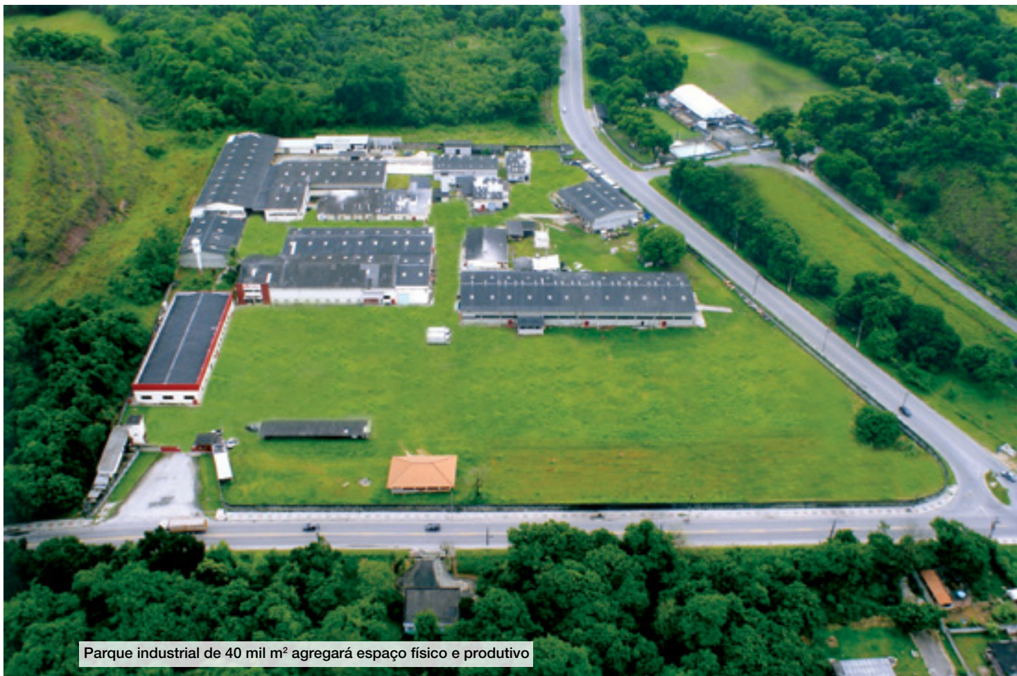
Parque industrial de 40 mil m 2 agregará espaço físico e produtivo

foram feitos grandes investimentos na área comercial, resultando em uma força de vendas mais robusta e posicionando a Sigma-Aldrich Brasil como umas das principais fornecedoras da área.