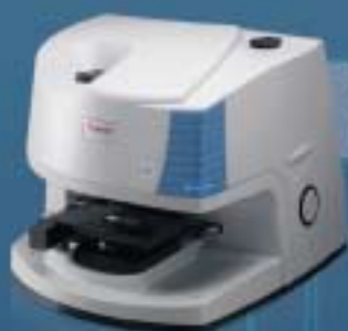
Nicolet iN10 Microscope

A Charis Technologies põe ao seu alcance toda linha de espectrometria por infravermelho da Thermo Scientific - líder mundial em instrumentação analítica.