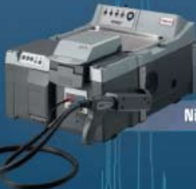
Nicolet Antaris II