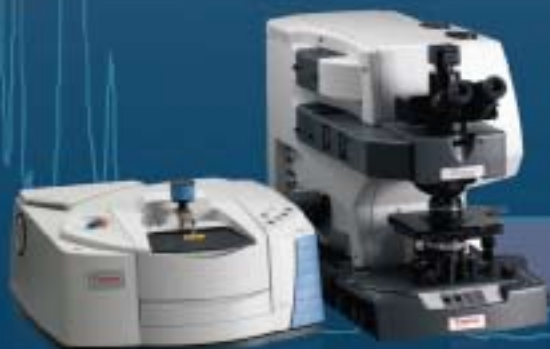
Nicolet iS10 + Continuum Microscope