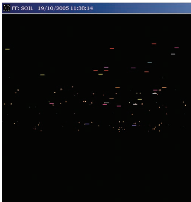
Figura 3. Imagem Total do Detector para amostra de solo

Uma Imagem Total do Detector foi executada na amostra de solo e o resultado pode ser visto na Figura 2. A Imagem Total do Detector expõe a amostra ao chip do detector CID, comprovando a análise e também a detecção de contaminações desconhecidas, devido à facilidade para subtrair uma imagem da outra. Uma Imagem Total do Detector é um gráfico descritivo do detector CID, com os comprimentos de onda baixos na direita inferior e os comprimentos de onda elevados na esquerda superior, assim como são detectados no detector CID. As faixas coloridas à direita do quadro indicam os elementos que foram selecionados para esse método (os pontos brilhantes na imagem indicam a intensidade do elemento na amostra). Por meio do comprimento de onda original, é possível identificar alguns dos elementos no CID no clique de uma